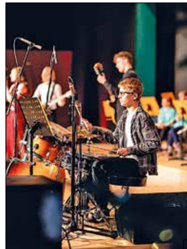
Die Schülerband „Von denen“