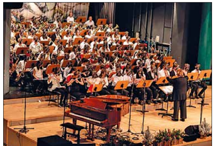
Das Orchester mit „The Star Wars Theme“